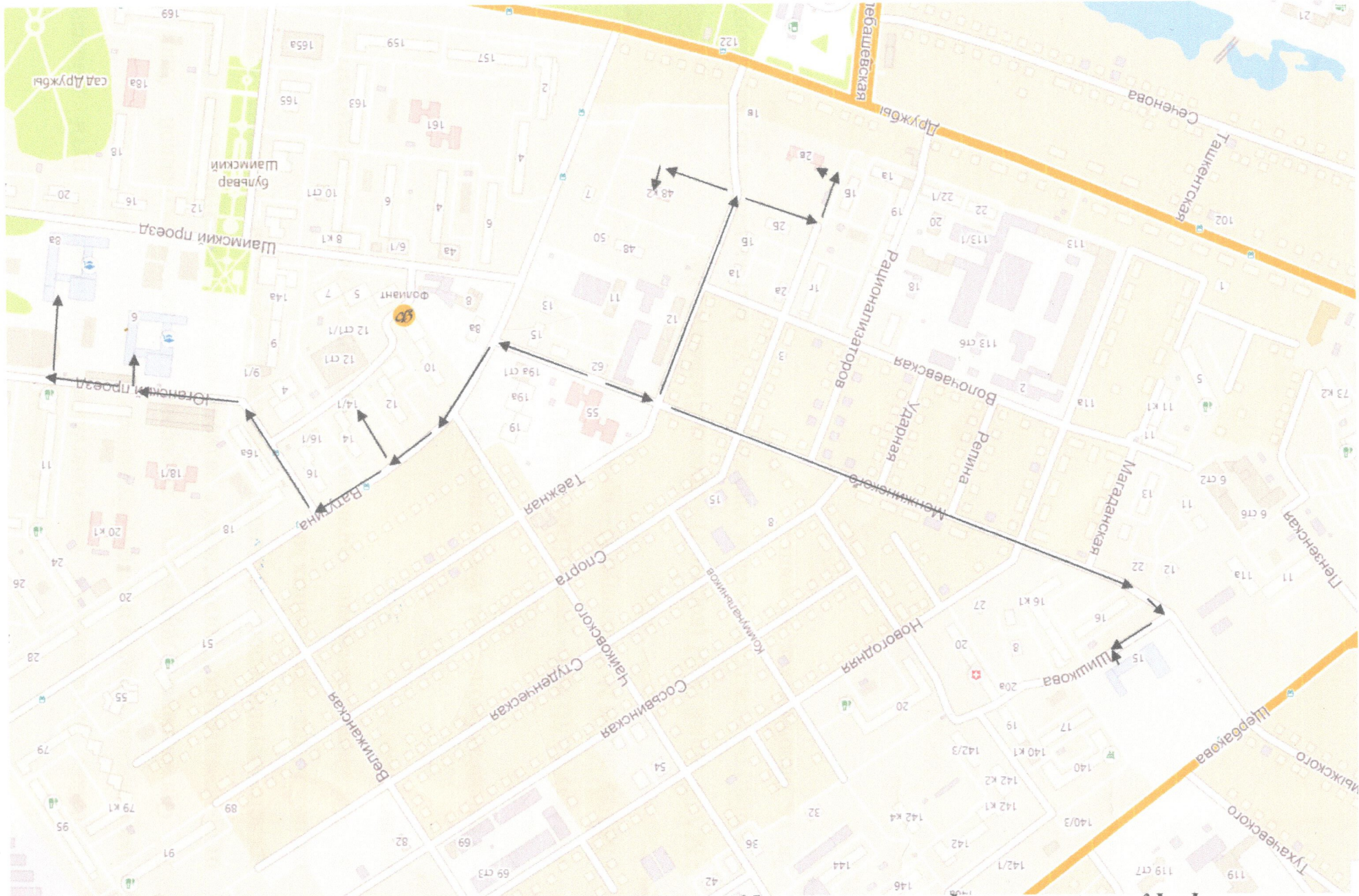
Схема маршрутов движения организованных групп детей от МАДОУ детского сада №133 города Тюмени